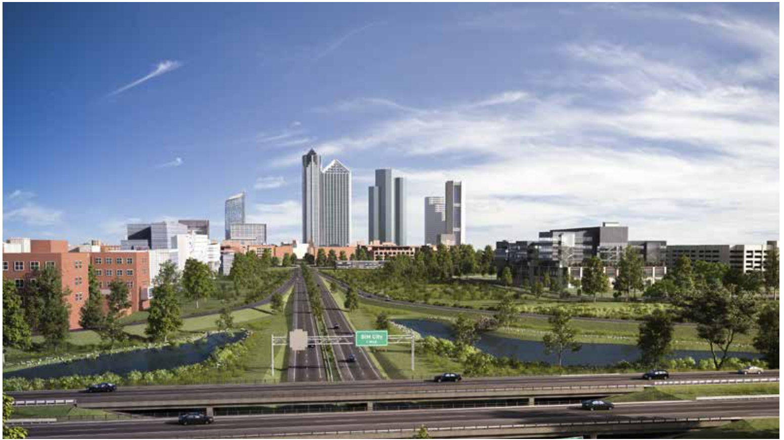
BIM City Infrastructure

Para iniciar los cursos en la fecha estipulada necesitamos contar con un mínimo de 6 alumnos, de no contar con el quórum, CDC Academia se reserva el derecho de postergar el inicio del curso.